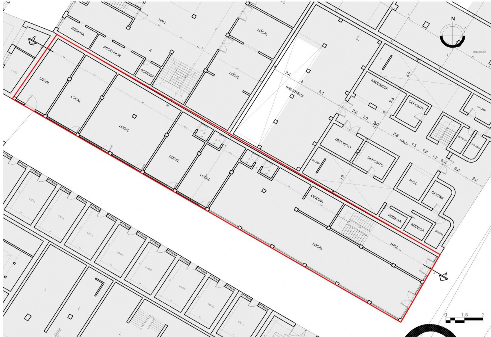
Planta primer piso